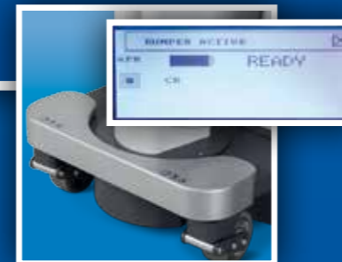
Sistema anticollisione Anticollision bumper