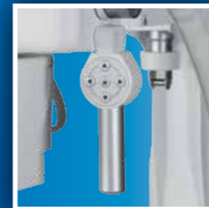
Comandi aggiuntivi per il posizionamento del letto del paziente Patient's bed fine adjustments command